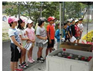
3・4年生は『365日の紙飛行機』の歌