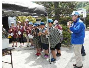
5・6年生は『コンドルは飛んでいく』の合奏