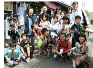
指方さんと記念撮影（3・4年生）