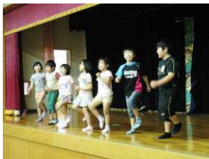
1・2年生は『手のひらを太陽に』の替え歌