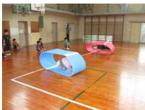
体力向上プロジェクト活動より