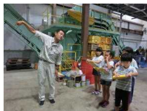
4年生：リサイクルセンター・炭化センター・浄水場見学